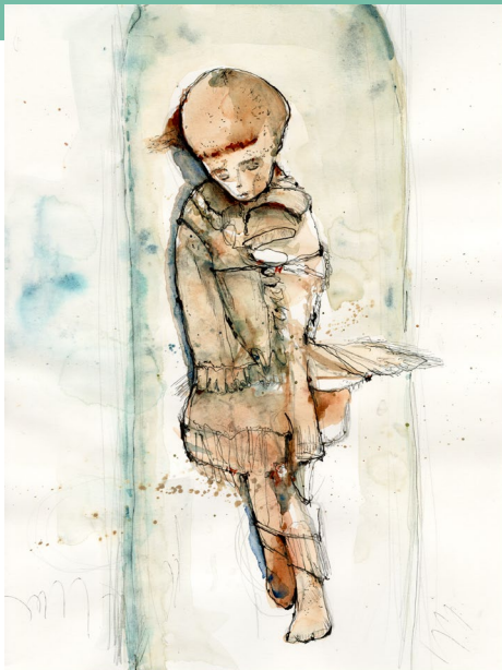
Sopra: L'individuo B035 aveva tra i 2 anni e mezzo e i 4 anni e mezzo alla morte. Questo bambino/a soffrì di piede cavo e strie di Harris, elemento che indica almeno un episodio di stress (ad es. malattia, malnutrizione) nel corso della vita. Il non-adulto in questione venne mummificato artificialmente.

L'assenza di altre patologie a livello radiologico suggerisce che condizioni acute o a breve termine (ad es. TB, colera o vaiolo) furono la principale causa di morte del campione in esame.