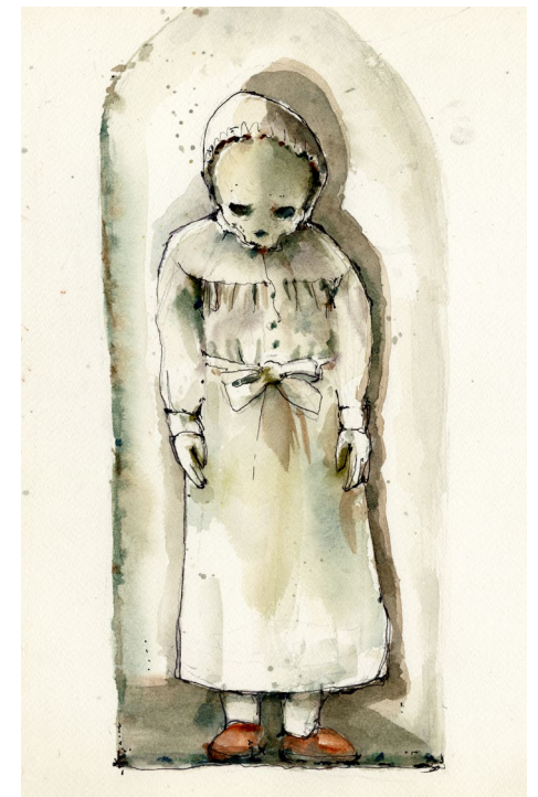
Sopra: l'individuo B032 aveva un'età compresa tra i 7 e i 9 anni al momento della morte ed è uno dei non-adulti più grandi nella stanza dei bambini. Questo individuo è stato mummificato naturalmente.

"I loro angeli in cielo guardano incessantemente il volto del Padre"